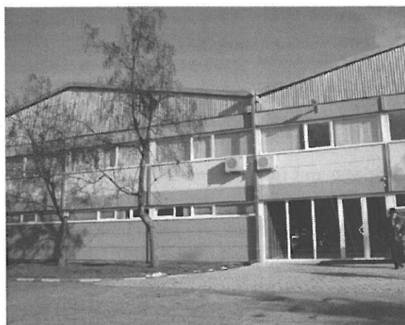
Slika 1. "Gorenje TIKI", Golubinački put bb, Stara Pazova

Parametri koji su ispitani u uzorcima otpadne vode, kao i odabir mesta uzorkovanja izvršeni su na zahtev poslodavca.